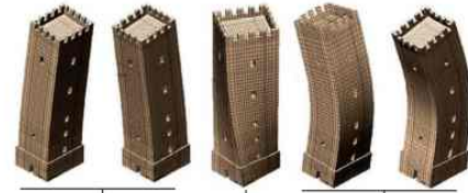
F1 R1 F2